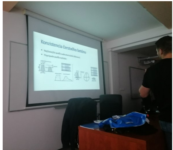
Označovanie cementov a možnosti skúšania konzistencie čerstvého betónu