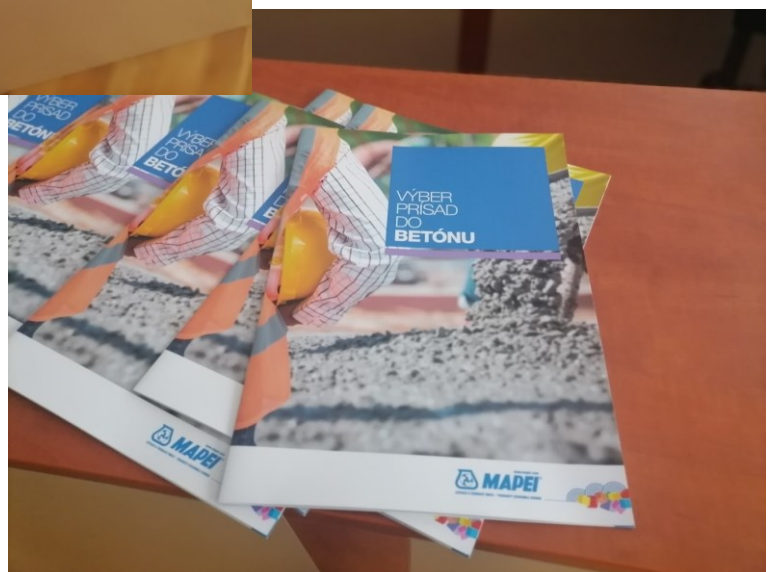
Produktové katalógy spoločnosti MAPEI SK, s.r.o.