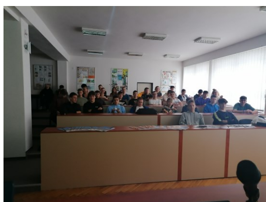
Žiaci SPŠS Žilina