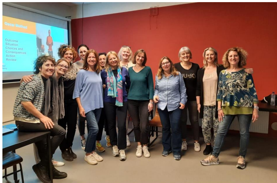
Vypracovala: Miriam Klimová