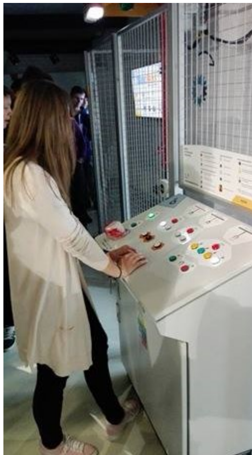
Elektromagnet - žeriav