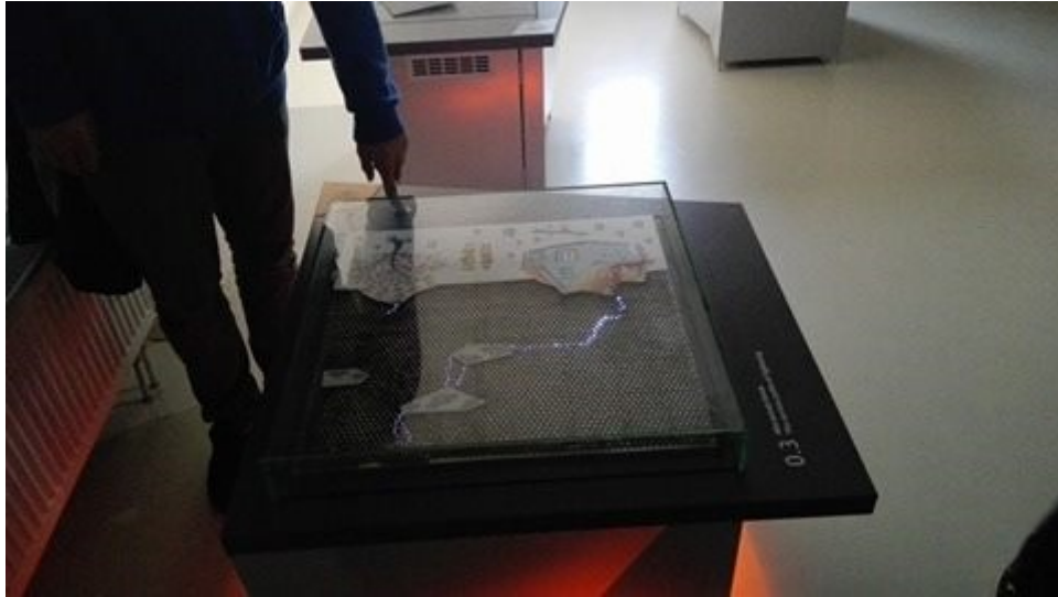
Ako vzniká blesk