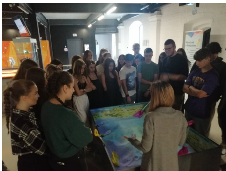
Výklad k téme...