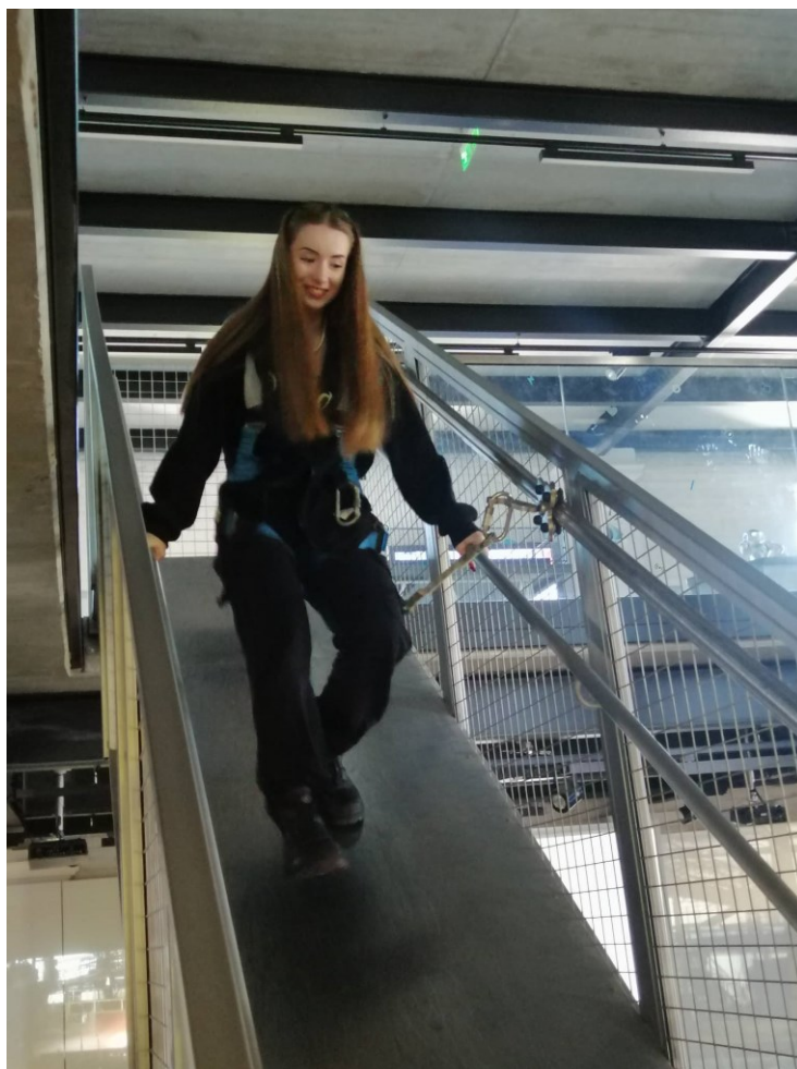
Magnetická naklonená rovina