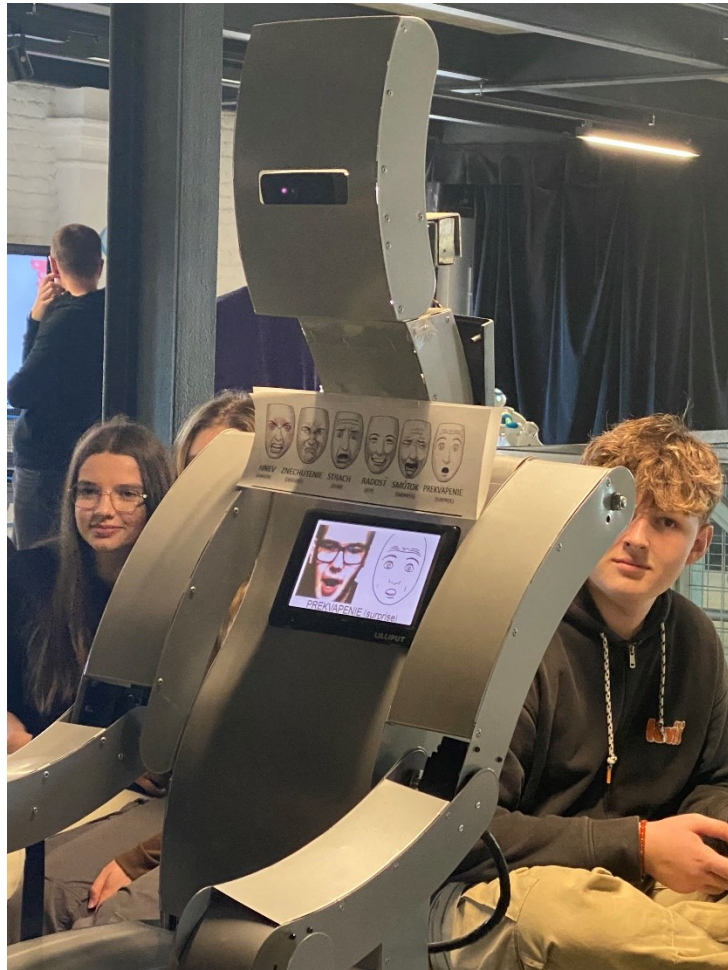
Posedenie pri robotovi čo hádal naše pocity