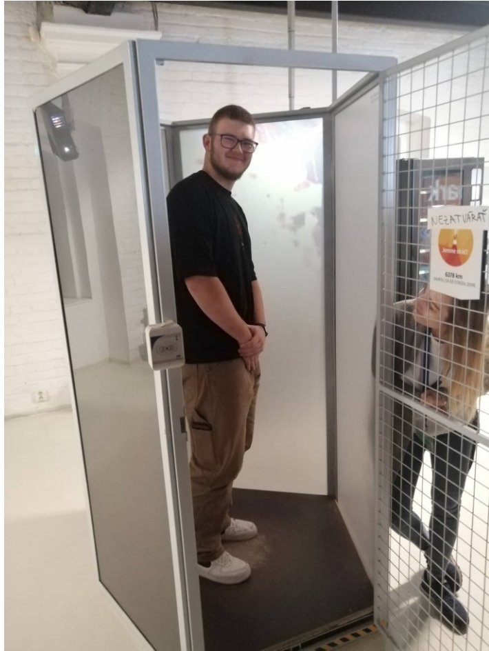
Cesta do stredu Zeme