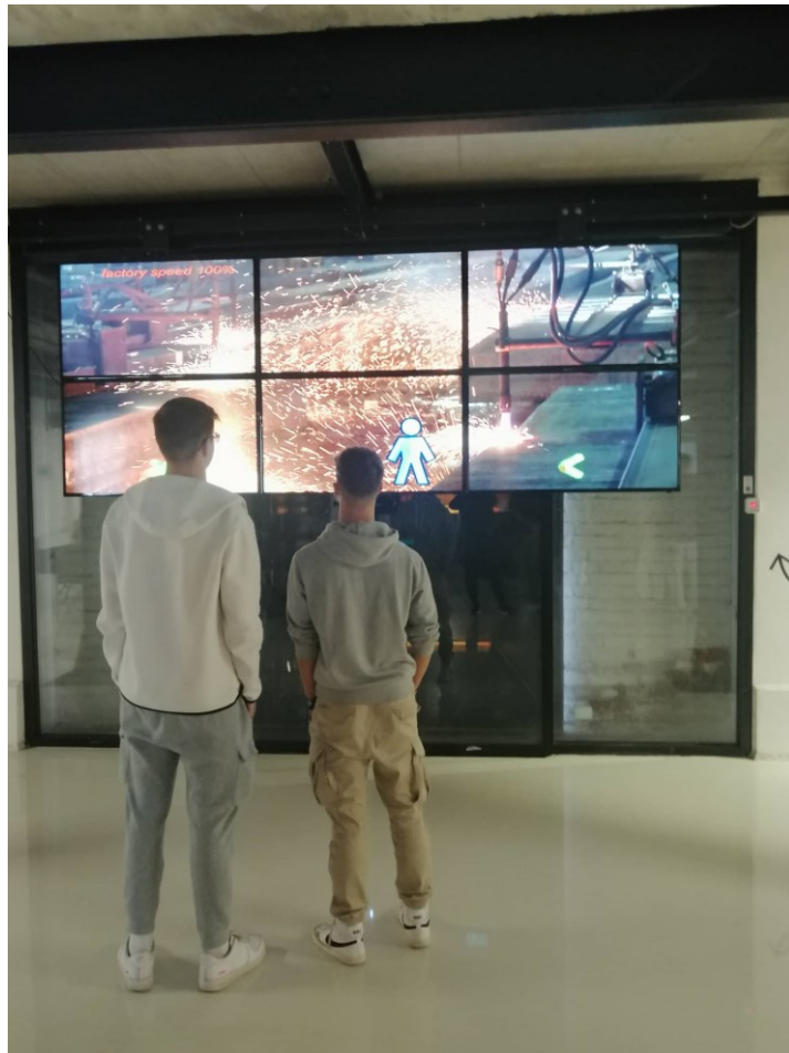
Spracovanie ocele – video